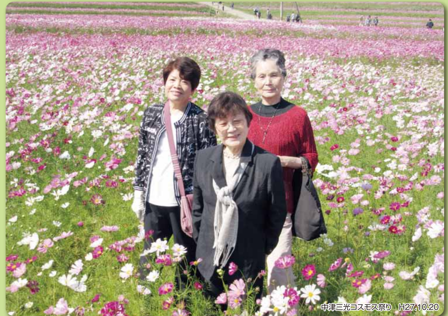
中津三光コスモス祭り H27.10.20

シルバーホーム TEL0977-26-1165 介護保険サービスセンター TEL0977-23-5533